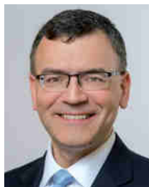
Dr. Markus Söder, MdL Bayerischer Ministerpräsident